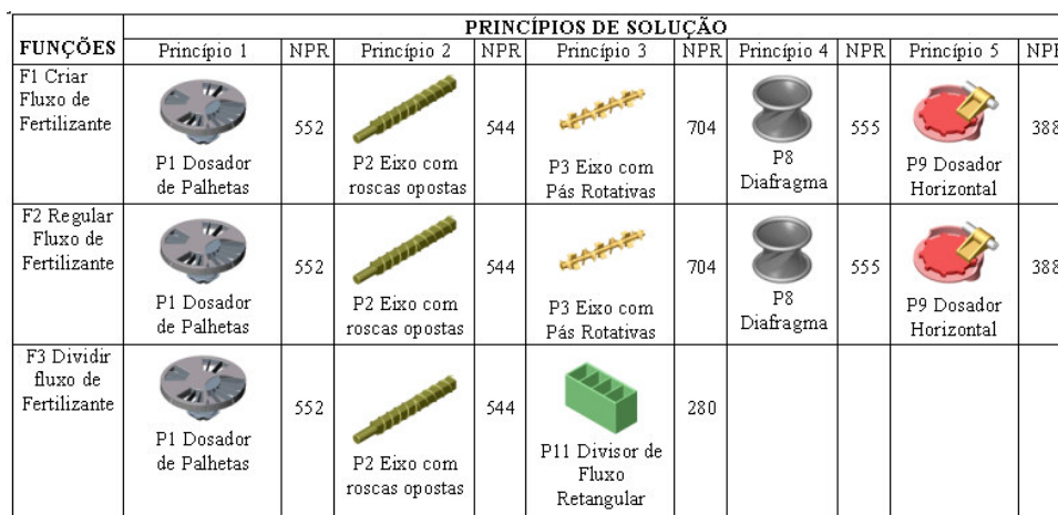
Figura 4: Matriz Morfológica Modificada com os valores dos NPRs para cada princípio de solução do dosador de adubo

Por fim, foi feita a combinação dos PSs para a obtenção das concepções para o produto. Foram então somados os NPRs dos PSs de cada concepção e chegou-se aos NPRs das concepções os quais estão mostrados no Quadro 3 .